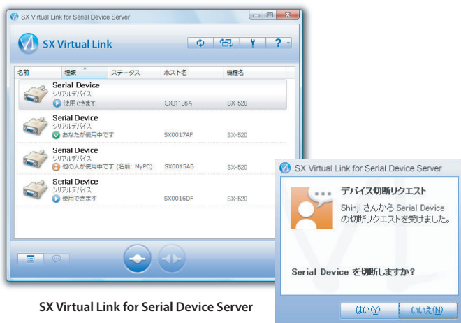
SX Virtual Link for Serial Device Server