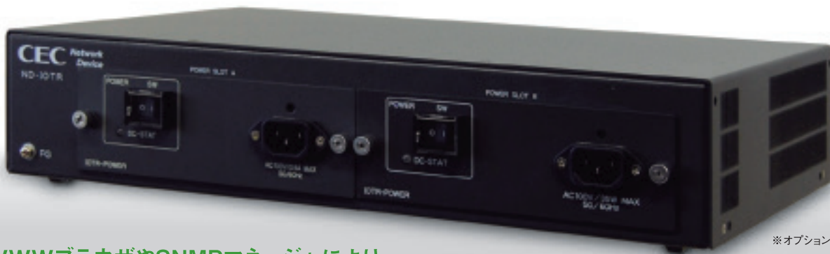
※オプションユニット実装時