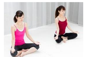
運動時の心拍・呼吸モニタ