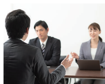
ヒアリング・面談