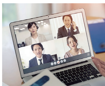
オンライン会議・ウェビナー