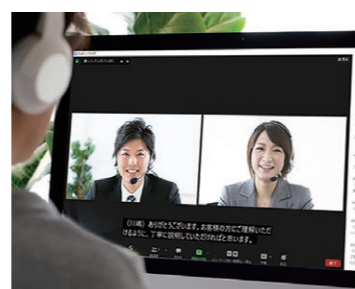
コミュニケーション支援