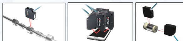
カムシャフトの形状測定