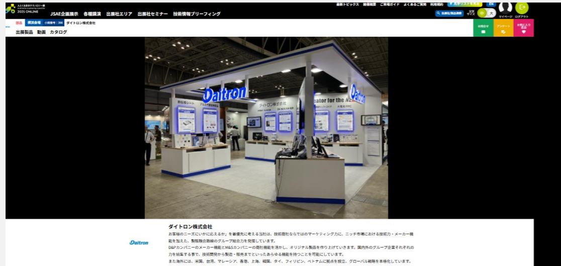
ダイトロン株式会社 お客様のニーズにお応えするために、事業拡大を図るには、技術者ならではのマーケティング力、ネット市場における認知力・メーカー機能を加え、動画制作のグループ協力を発注しています。 DMPカンパニーのメーカー機能とM&Aカンパニーの認知機能を活かし、オリジナル製品を作り上げていきます。国内外のグループ企業それぞれの力を結集することで、技術開発から製造・販売までといったあらゆる機能を持つことが可能になっています。 また海外には、米国、台湾、マレーシア、香港、上海、韓国、タイ、フィリピン、ベトナムに拠点を設立、グローバル展開を推進しています。